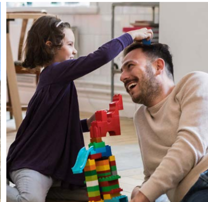
Photos prises avant les mesures de sécurité de distance physique COVID-19