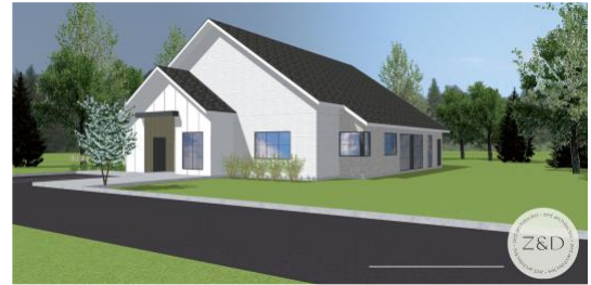
Modèle 1 – Studios communautaires modèle 1 étage, 4 unités

De plus, le modèle peut facilement être construit par des entrepreneurs locaux, ne requiert pas de matériaux ni d'équipements particuliers et s'installe facilement sur des terrains de petites tailles de 1 280 m 2 à 1 320 m 2 (13 800 pi 2 à 14 120 pi 2 ).