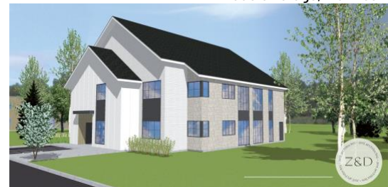
Modèle 2 – Studios communautaires modèle 2 étages, 8 unités