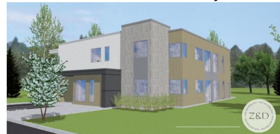
Modèle 3 – Studios communautaires variante modulaire