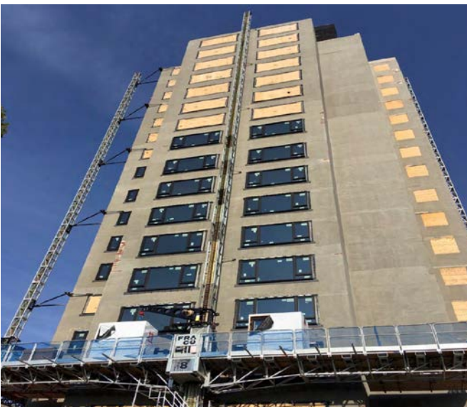
Figure 1: Renouvellement de la tour Ken Soble à Hamilton (Ontario)