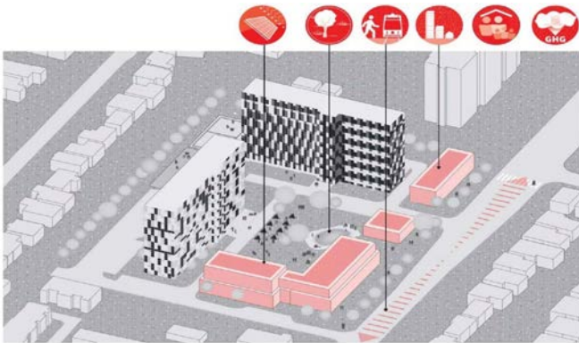
Figure 2 : Permettre la création de collectivités complètes